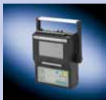
FUP1010 (portátil estándar)

Portátil Uso en zonas no peligrosas. Estándar interior o de intemperie