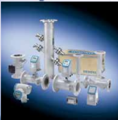
Familia de caudalímetros ultrasónicos intrusivos Siemens SITRANS F US