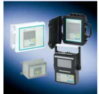
FUS1010, FUS1020 y FUP1010, soluciones no intrusivas dedicadas y portátiles.