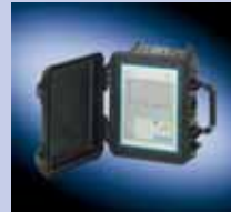
FUE1010 (de dos canales estándar)

Antideflagrante Uso en zonas peligrosas, en interiores o exteriores