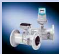
SONO 3300 IP67