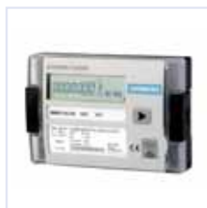
FUE950 calculador de energía

Los FUS/E380 se pueden utilizar dentro de un sistema de conteo de energía robusto y fiable.