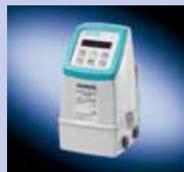
SONO 3000 IP67

General Homologados y de instalación compacta