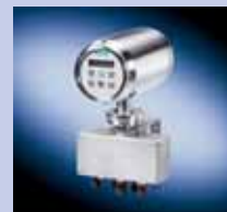
SONO 3000 AISI IP65