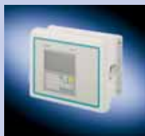
FUS1010, FUE1010, FUH1010, FUG1010

Montaje mural Uso en interiores no peligrosos