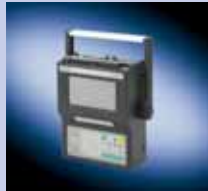
FUE1010 (monocanal estándar)