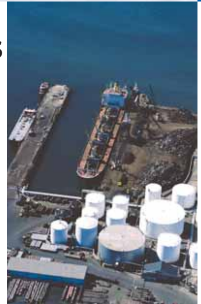
FUH1010 diseñado especialmente para operaciones de tuberías con hidrocarburos.

Los caudalímetros FUS1010 y FUP1010 también se pueden utilizar en muchas aplicaciones de hidrocarburos bajo condiciones de aplicación limitadas, como un solo líquido, condiciones de operación estables y rango de viscosidades limitado. Consulte las especificaciones de los FUS1010 y FUP1010 en la sección de aguas.