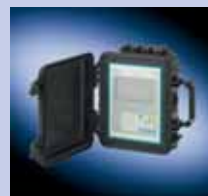
FUP1010 (portátil impermeable)