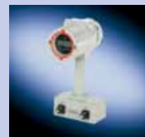
FUS1010, FUH1010, FUG1010 (compacto)

Antideflagrante Uso en zonas peligrosas, en interiores o exteriores