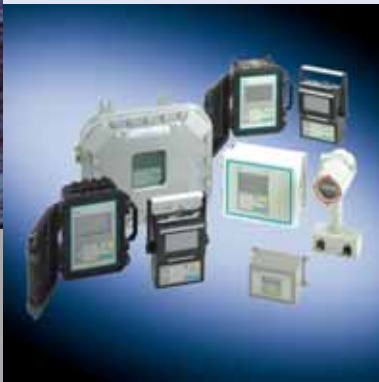
Familia de caudalímetros ultrasónicos no intrusivos Siemens SITRANS F US